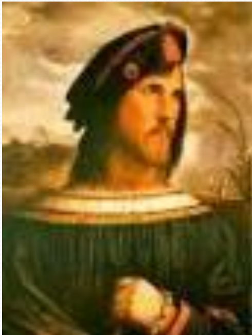
Портрет Цезаря Борджиа